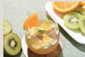
WHITE SANGRIA 白サングリア