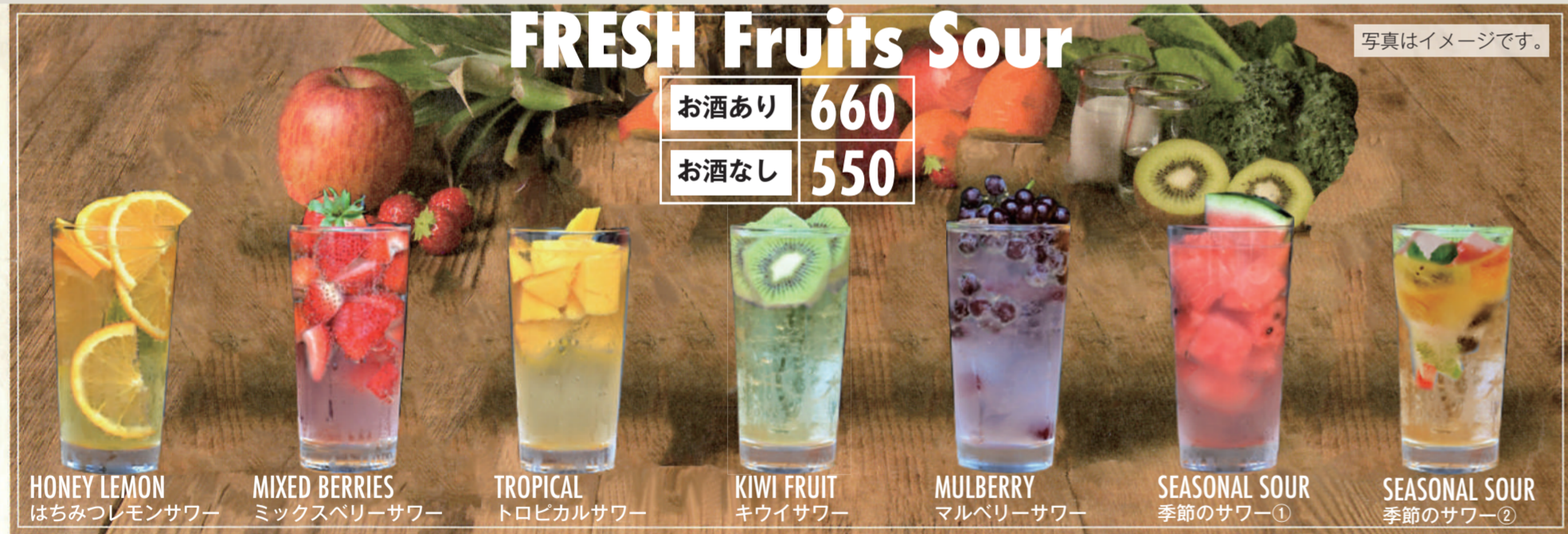
HONEY LEMON はちみつレモンサワー MIXED BERRIES ミックスベリーサワー TROPICAL トロピカルサワー KIWI FRUIT キウイサワー MULBERRY マルベリーサワー SEASONAL SOUR 季節のサワー① SEASONAL SOUR 季節のサワー②