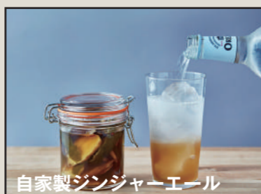
自家製ジンジャーエール

MANGO マンゴー / APPLE りんご / CRANBERRY クランベリー / GUAVA グァバ